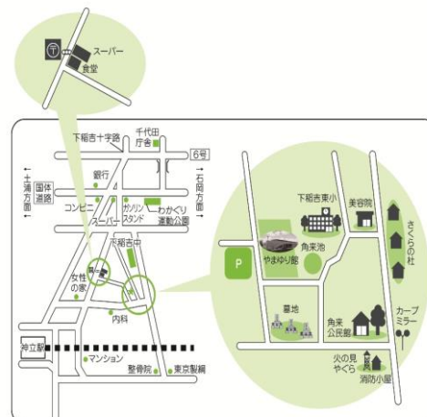
やまゆり館案内図